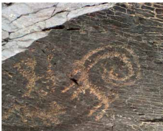
تصویر ۴- سنگ‌نگاره بز کوهی در حال جست زدن برای چیدن گیاه که در روی سفالینه باستانی متعلق به ۵۰۰۰ سال پیش از میلاد، شهر سوخته نیز یافت شده است، عکاس: محمد ناصری فرد، یافت شده در دره شماره یک مزاین خمین. مأخذ: (ناصری فرد، ۱۳۸۸: ۵۲).

دوران نوسنگی ۷ (۷۵۰۰-۵۰۰۰ ق.م) دارای دستاوردهای شامل گسترش کشاورزی (تولید گندم و جو) و اهلی کردن حیواناتی شامل بز، میش، گوسفند و اسب، اختراع چرخ و قایق، تکنیک کار با سفال، آشنایی با بافت البسه و ریسندگی، ایجاد واحدهای اجتماعی نظیر روستاها با نظام‌های مشارکتی ساده، نهادینه شدن برخی باورهای آیینی و اعتقادی، بوده است. شکل‌گیری حرفه‌هایی نظیر، دام‌پروری، کشاورزی، ریسندگی، شکار و سفالگری را می‌توان در این دوران دید. فرایند مهاجرت نیز در