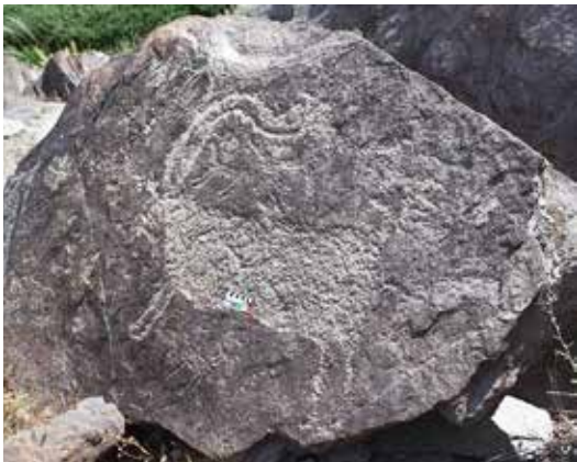
تصویر ۲- نقش بز کوهی با شاخ‌های موج‌دار بر سنگ‌نگاره بازمانده از ۷۰۰۰ سال پیش از میلاد (نوسنگی)، یافت شده در تیمره خمین (۱۳۳×۱۱۴ سانتی‌متر)، موج‌دار بودن شاخ بیان‌کننده نماد آب و جریان است.