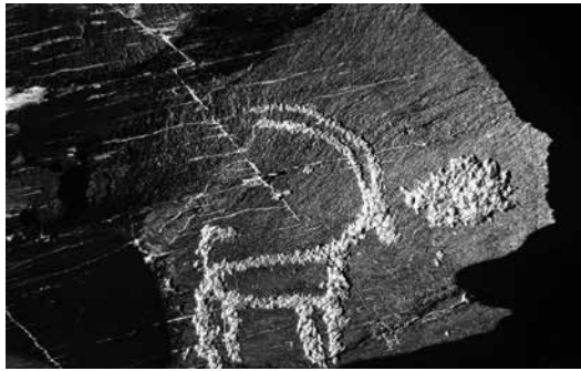
تصویر ۱- سنگ‌نگاره بز کوهی ساده‌شده یافت شده در کوه‌های خراوند، متعلق به دوره پارینه‌سنگی.