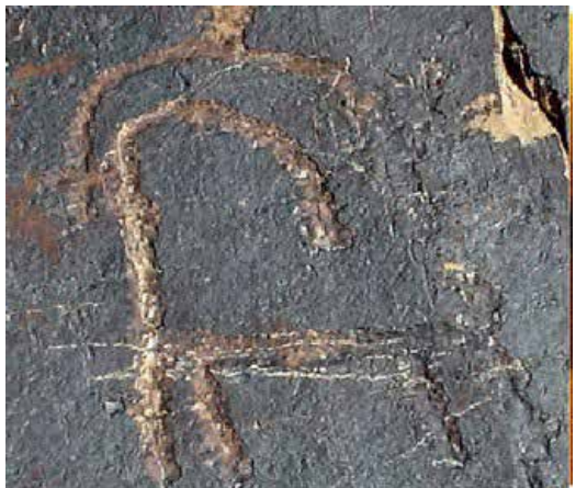
تصویر ۳- سنگ‌نگاره بز کوهی یافت شده در سرکوبه خمین متعلق به دوران نوسنگی. مأخذ: (ناصری فرد، ۱۳۸۸: ۱۲).

از بدو خلقت همواره هنرمند با خلق اثر تلاش کرده است یک ارتباط بصری با دنیای اطراف و بیننده برقرار نموده و پیغامی را به مخاطب ارسال نماید. در طول زمان نوع و کیفیت این ارتباط بصری تغییر نموده و ارزش‌های فرهنگی، اعتقادی را نیز در بر گرفته است، بصورتیکه هنر تجلی بارز فرهنگ هر قوم و ملتی شده است. تولستوی بیان می‌دارد که هنر عالی‌ترین تجلیات تصور خدا، زیبایی و لذت روحی و معنوی است.